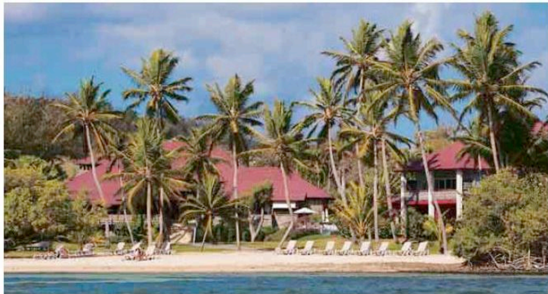
El sueño de las vacaciones perfectas parece cumplirse con tan sólo poner un pie en el Hotel Relais & Châteaux Le Cap Est Lagoon , en Isla Martinica

Jamaica regala al viajero uno de los 10 mejores hoteles de playa del mundo, The Caves